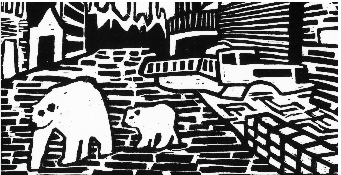
Abbildungen: Narrative Druckgrafiken zum Thema «Tiere in menschlichen Räumen», 26g KF BG