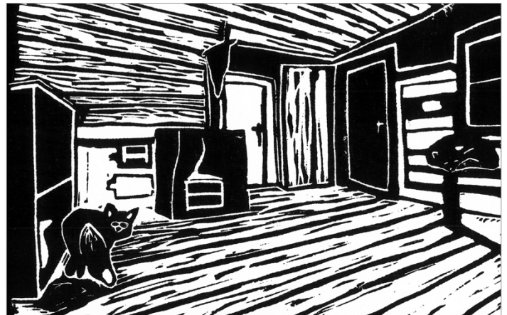
Abbildungen: Narrative Druckgrafiken zum Thema «Tiere in menschlichen Räumen», 26g KF BG